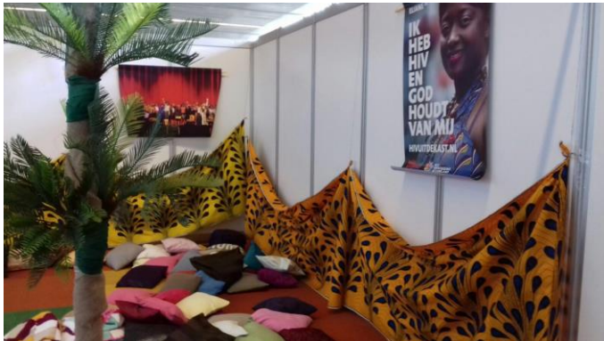
Figuur 2 | De afgeschermdde ruimte binnen de druk bezochte Networking Zone for African Women: WE ARE FAMILY

Samen met hen allen hebben wij over toekomst en dromen gesproken, gediscussieerd op het scherpst van de snede, ervaringen uitgewisseld - over levenskeuzes, migratie, seksualiteit, activisme, moederschap, geloven, lesbisch leven - en zegenspreuken gedeeld, gelachen, gegeten en gehuild.